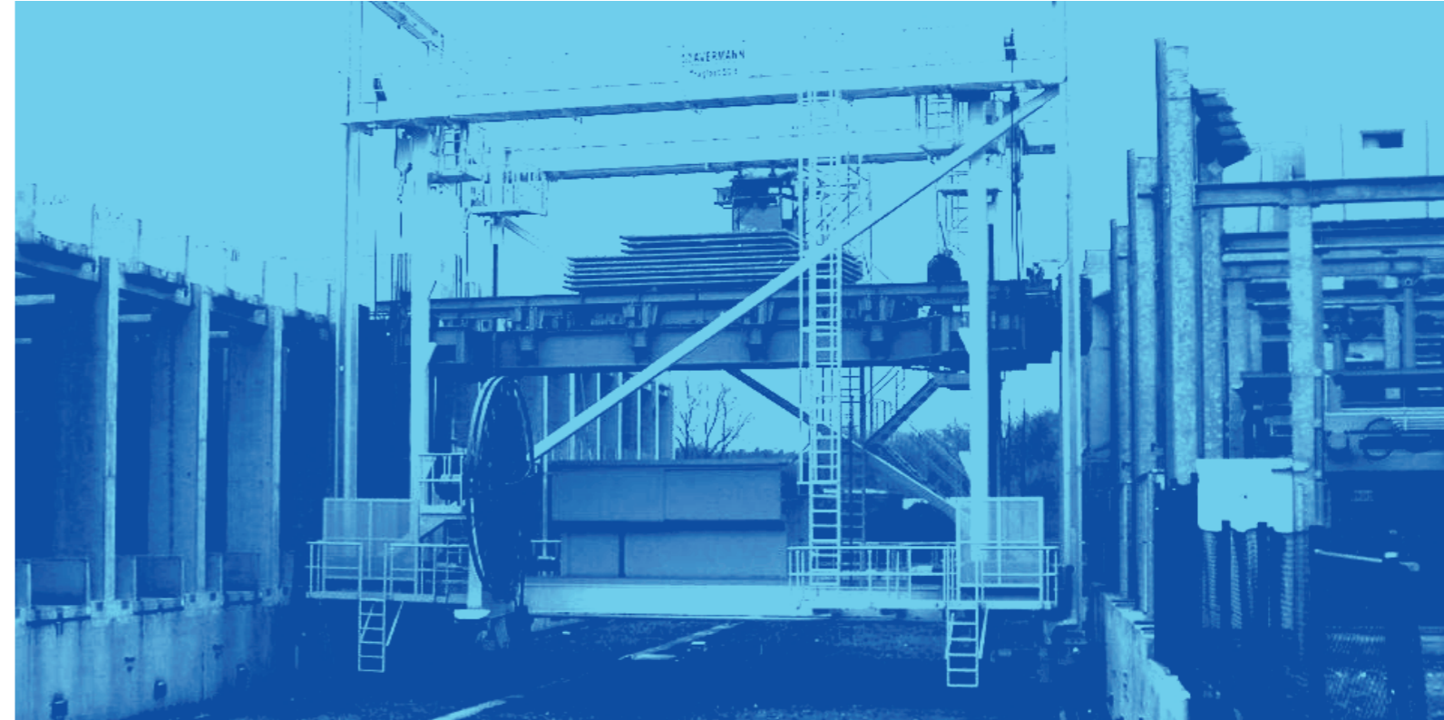
Europas größtes Regalbediengerät